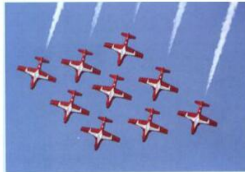
生活中的重复现象